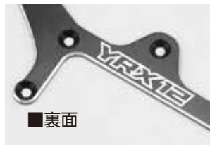
YRX 12用 アルミ製 ロア ブレース (70-75 ジュラルミン材使用)