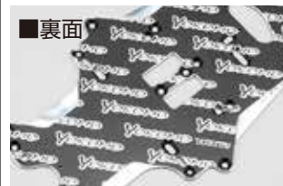
YRX 12用 アルミ製 メインシャーシ (70-75 ジュラルミン材使用)