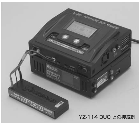
YZ-114 DUO との接続例