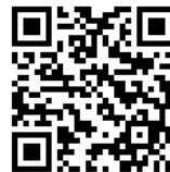
エントリー用QRコード

エントリーURL : https://ws.formzu.net/dist/S53541303/